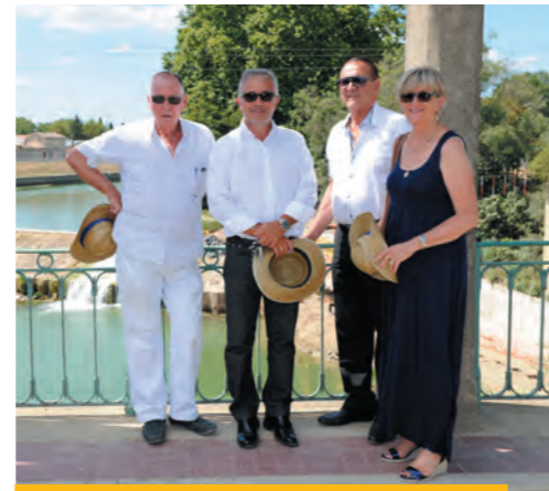
Le Président de l'EPTB Vidourle, le Directeur général des services de l'EPTB Vidourle, le Président du Conseil départemental de l'Hérault, et Madame la Conseillère départementale.

6 2013 DIGUE DE 1 ER RANG DE MARSILLARGUES