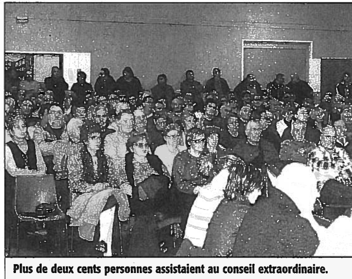
Plus de deux cents personnes assistaient au conseil extraordinaire.

Les faits lui ont donné raison. Dix-sept voix se sont prononcées en faveur du plan Vidourle, onze contre et un bulletin nul. C'est donc la fin d'un long bras de fer qui, depuis 2004, oppose le Syndicat intercommunal d'aménagement du Vidourle (Siav) à la Ville de Marsillargues. Elle était la seule commune, sur l'ensemble du bassin versant